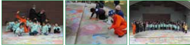
▲ハケ岳 ART FESTIVAL 2009 オープニング・イベントより

●ナビゲーターの松村雅子さん（「えほん村」主宰、絵本作家）と一緒に、チョークとハケ岳南麓の落ち葉を使って、みんなで大きな「木」を描いてみませんか？ 画材の落ち葉が堆肥となるまでを学べるレクチャーもあります（13:40～14:00 講師：NPO法人ハケ岳自然村）。どなたでも自由に参加できますので、よごれてもいい服装で遊びにきてください。会場では軽食の販売もあります。